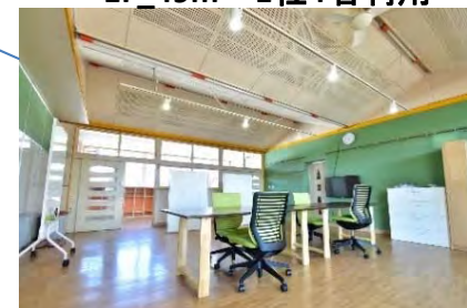
2F_49m 2 1社4名利用