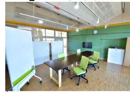
1F_49m 2 1社4名利用