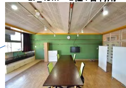
1F_49m 2 1社4名利用