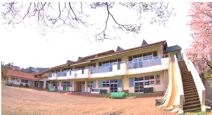
1F_185m 2 都心勤務テレワーカー16名利用