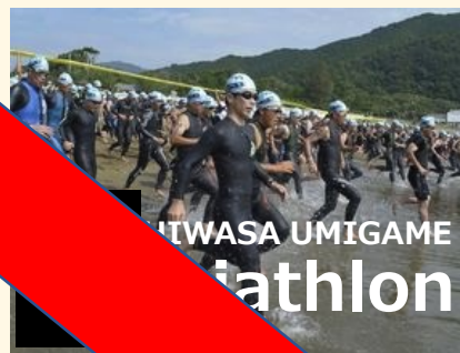
MIWASA UMIGAME athlon