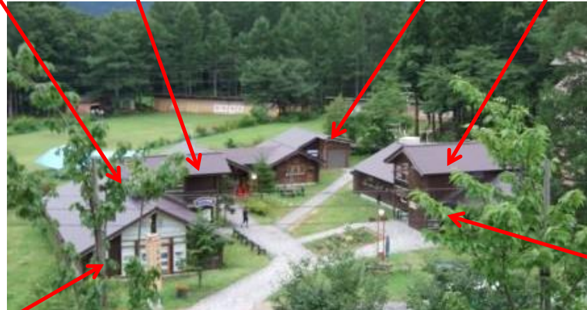
————— Yahoo! HAKUBA BASE —————