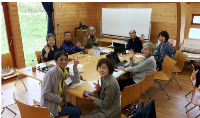
シニア層によるIT学習サークル 「スマホレジェンドの会」