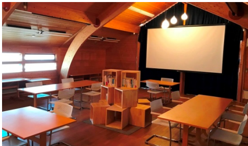
1 F ワーキングスペース 2 (イベント対応可)