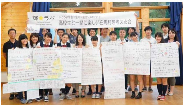
白馬高校公営塾「しろま學舎」プロジェクト学習 ～輝☆ラボ～ 信州大学×慶應SDM×Yahoo!JAPAN

子どもから大人まで、国内外の多様な人材の交流機会を創出し、地域に資する人材を育成する。