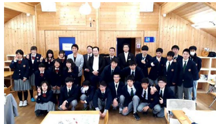
白馬高校国際観光科による「高校生ホテル」に向けた Yahoo!トラベル特別授業～宿泊プラン作成・販売～