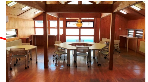
1 F ワーキングスペース 1