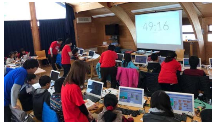
Yahoo!JAPANによる小学生向けプログラミング教室 Hack Kids Caravan in Hakuba