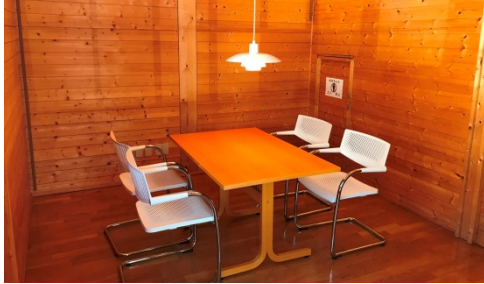
2 F ミーティングルーム (オンライン・オフライン)