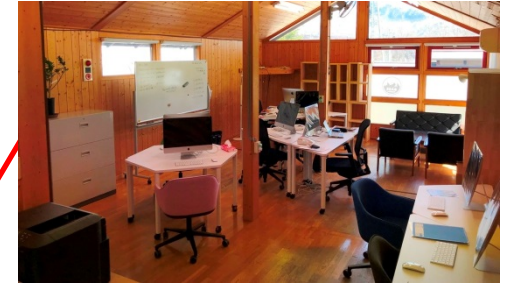
2 F サテライトオフィス (ヤフー株式会社)