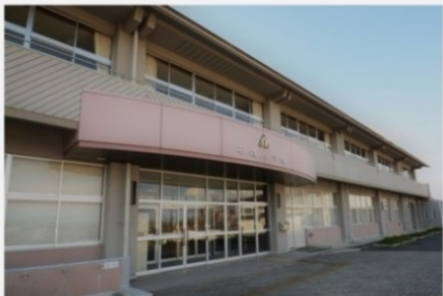
旧石森小学校サテライトオフィス/テレワークセンター