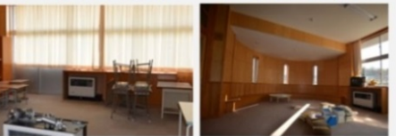
テレワークセンターC テレワークセンターD