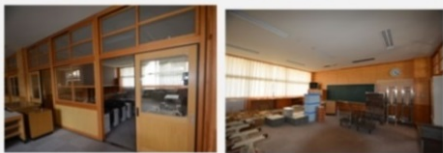
サテライトオフィスA サテライトオフィスB